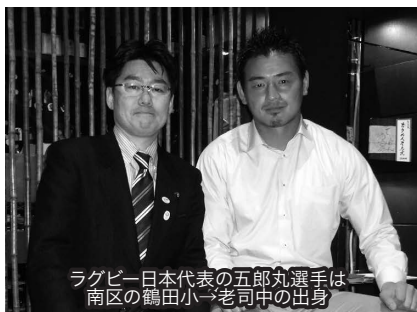
ラグビー日本代表の五郎丸選手は 南区の鶴田小→老司中の出身