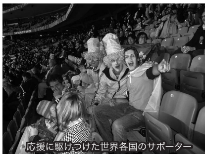
応援に駆けつけた世界各国のサポーター