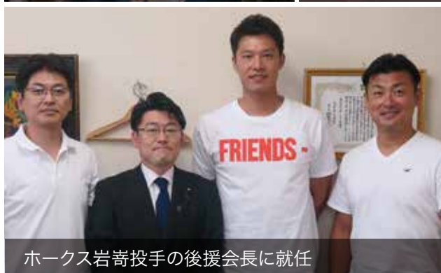
ホークス岩寄投手の後援会長に就任