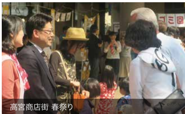
高宮商店街 春祭り