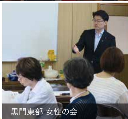
黒門東部 女性の会