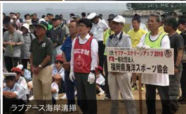
ラブアース海岸清掃