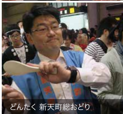
どんたく 新天町総おどり