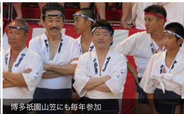
博多祇園山笠にも毎年参加